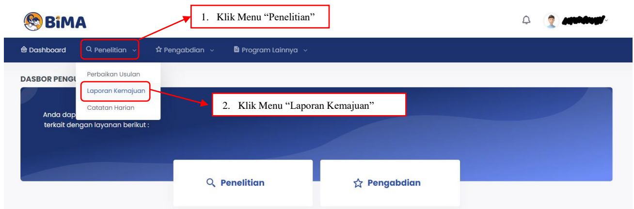
Gambar 1. Submenu Laporan Kemajuan

Pelaporan kemajuan penelitian dilakukan melalui BIMA dengan menggunakan user dan password yang sama yang telah dimiliki oleh dosen. Pilihan melaporkan kemajuan penelitian dapat diawali dengan memilih menu “Penelitian” dan submenu “Laporan Kemajuan” sebagaimana ditampilkan pada Gambar 1.