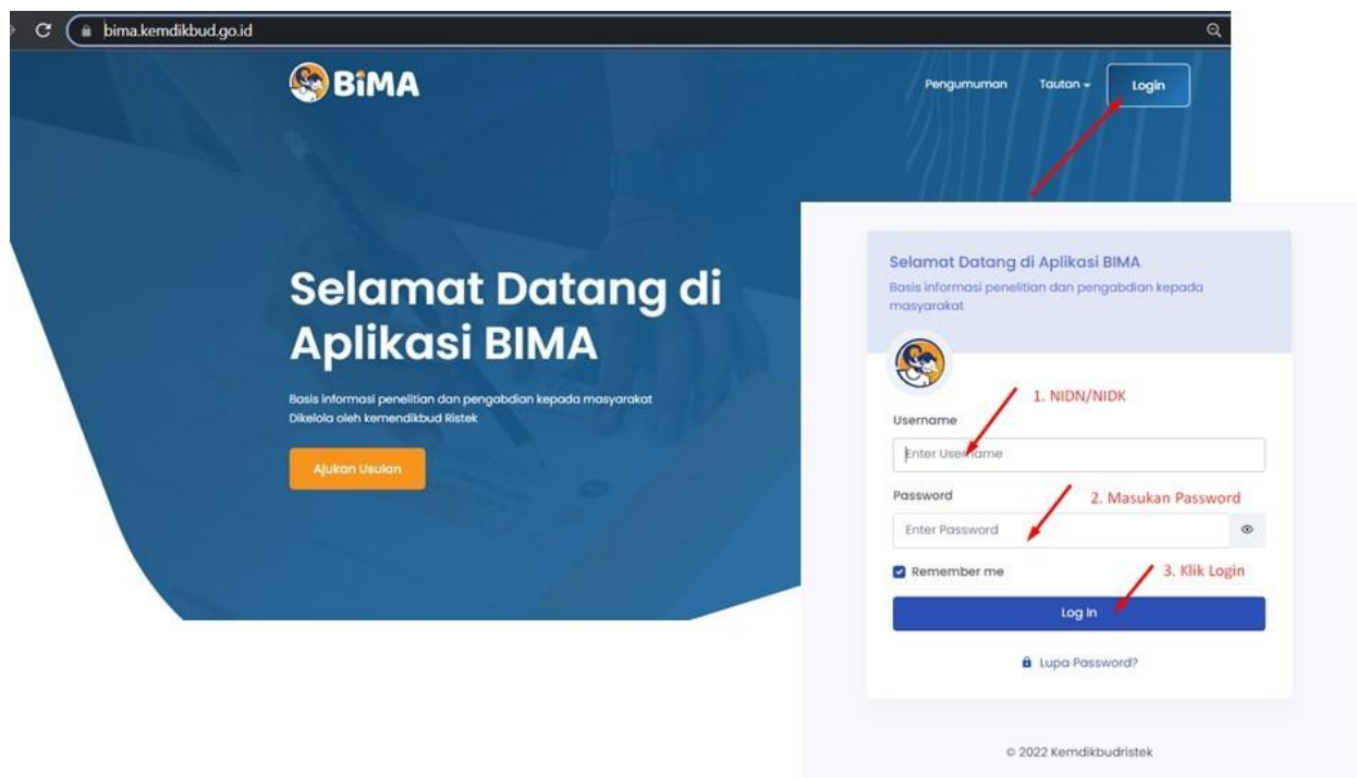
Gambar 1. Beranda akses memasuki aplikasi BIMA

Penerima pendanaan penelitian di Perguruan Tinggi Akademik Tahun Anggaran 2023, wajib melakukan revisi proposal, rencana anggaran biaya (RAB), dan mengunggah surat pernyataan kesanggupan pelaksanaan sedangkan penerima pendanaan pengabdian kepada masyarakat di Perguruan Tinggi Akademik Tahun Anggaran 2023, wajib melakukan revisi rencana anggaran biaya (RAB) dan mengunggah surat pernyataan kesanggupan melalui aplikasi BIMA pada laman http://bima.kemdikbud.go.id/ dengan menggunakan akun ketua pengusul masing-masing, sebagaimana diperlihatkan pada Gambar 1.