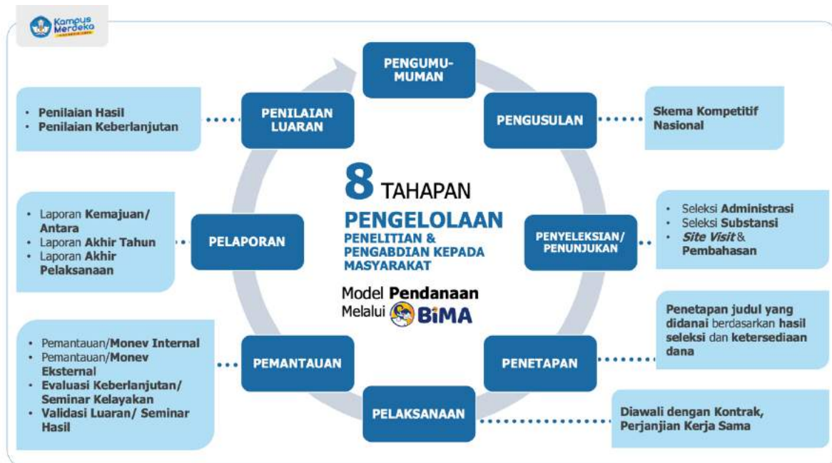
Gambar 1.1 Alur Kegiatan Pengelolaan Penelitian dan Pengabdian kepada Masyarakat

Dalam rangka pelaksanaan fasilitasi sekaligus fungsi pemantauan, evaluasi, dan pelaporan di bidang riset dan pengabdian kepada masyarakat, DRTPM dan DAPTIV memiliki alur kegiatan pengelolaan penelitian dan pengabdian kepada masyarakat seperti tercantum pada Gambar 1.1.